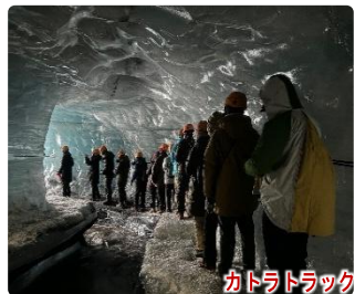
カトラトラック・アイスケイブ歩き