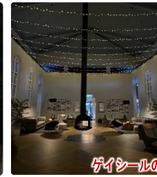
ゲイシールの5☆ホテル