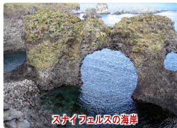
スナイフェルスの海岸