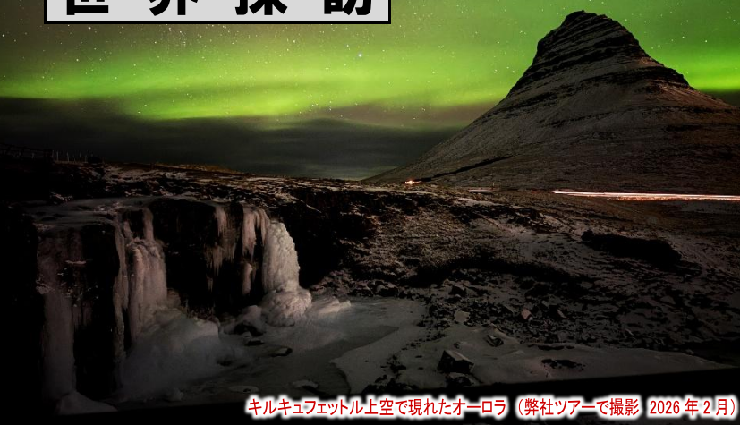
キルキュフェットル上空で現れたオーロラ (2026年2月)