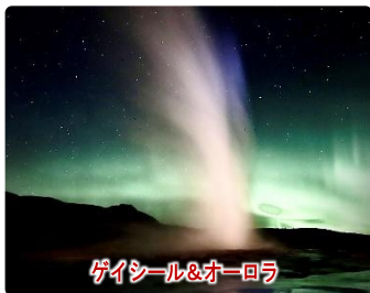
ゲイシール&オーロラ