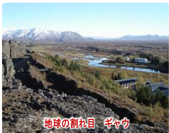
地球の割れ目 ギャウ