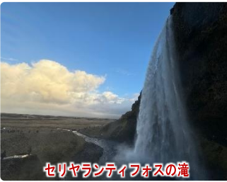
セリヤランティフォスの滝