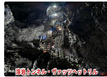
溶岩トンネル・ヴァッツヘットリル