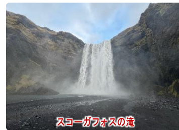
スコウガフォスの滝