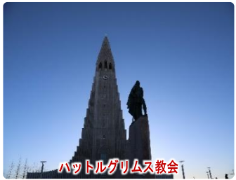
ハットルグリムス教会